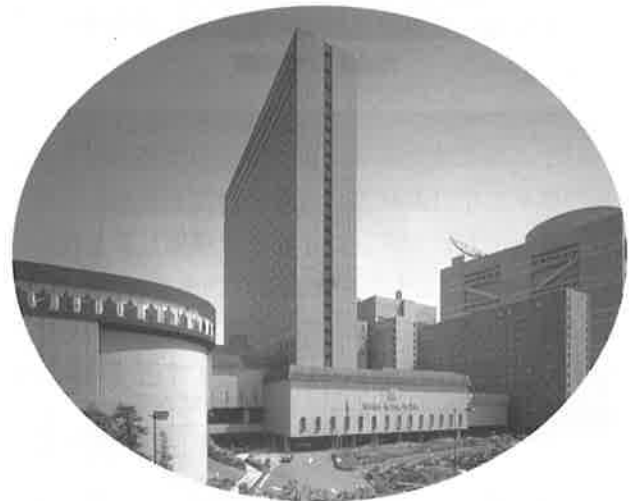
大阪開催の会場となるリーガロイヤルホテル