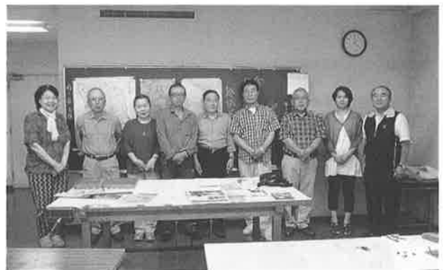
学習会が終わって記念撮影