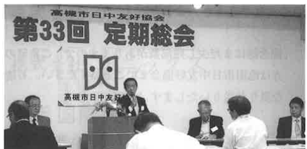
高槻市日中 第33回定期総会