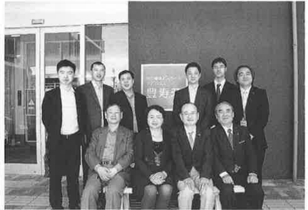
揚州市経済技術開発区訪日団一行 豊寿荘にて

昼食は入居者と同じ食事を味わって頂きながら、今後の中国における高齢者福祉と介護について、意見交換をして交流を深めることができました。