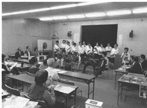
昨年の定例総会后、地域市民団体との交流

定例総会)を松原図書館で開催し総会終了後の午後から地域一般の方と共に中国映画観賞会並びに展示会を開催し、展示会には、地域の市民団体にも呼び掛けて市民協働活動を行います。