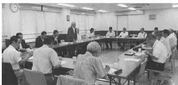
多くの地区協会会長が参加しての会長会議

7月24日、本年度第1回の地区協会会長会議を大阪スカウト会館3Fで開催しました。