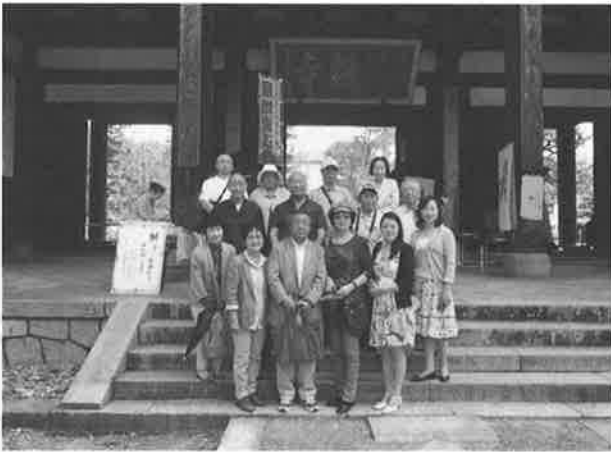
宇治市萬福寺へのバスツアー（6月8日）

6月8日(日)26年度市日中友好協会定時総会を恒例の日中バスツアーの車中で開催しました。