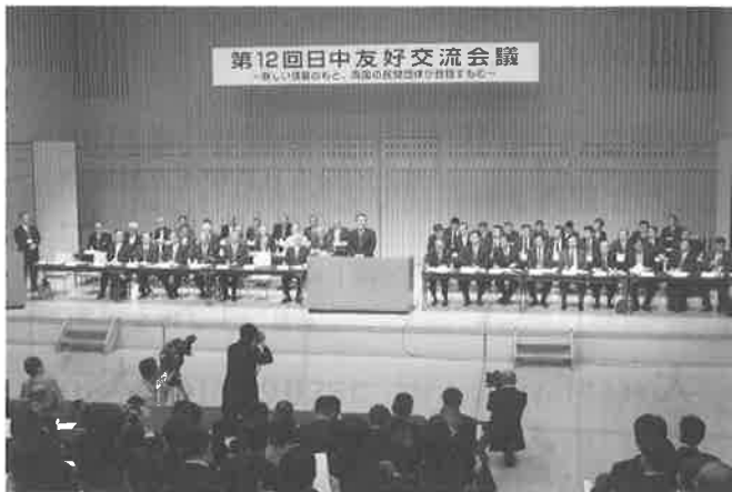
2009年 第12回日中友好交流会議(高松市)での会議