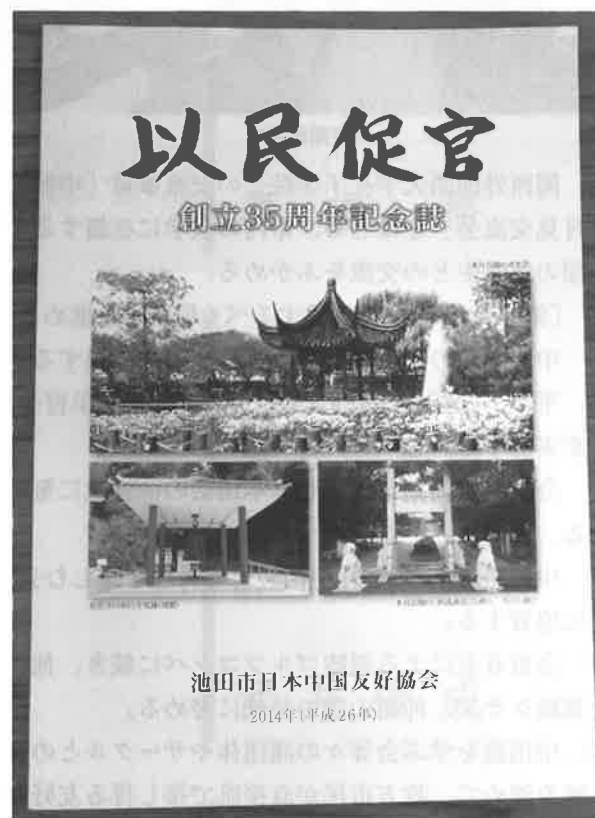
池田市日中 創立35周年記念誌