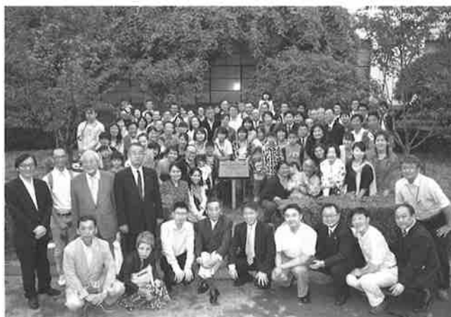
上海魯迅記念館で多くの関係者と記念撮影

本年2月23日豊中日中の願望でありました魯迅と西村真琴の秘められた友情についての展示会、講演