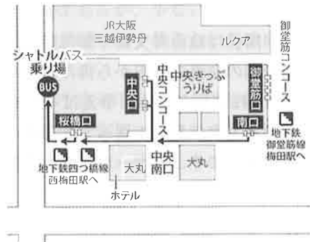
《大阪駅バスのりば》