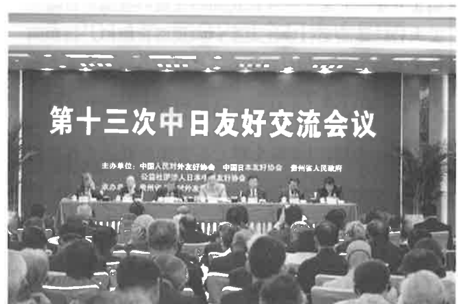
2012年 第13回日中友好交流会議(貴陽市)での会議