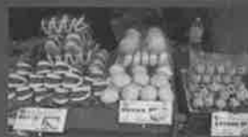
※写真は 2013 年の撮影です