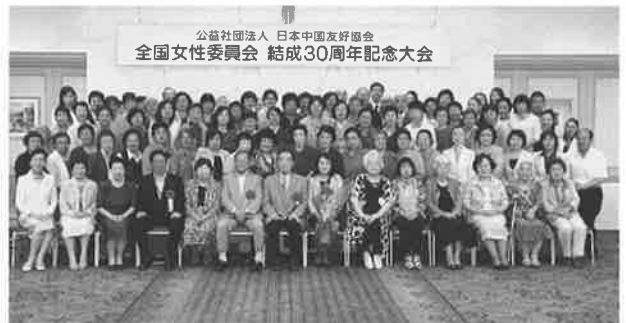
全国女性委員会 結成30周年での記念撮影